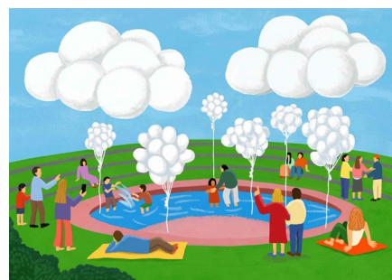
TOMORROW POSITIVE イメージ

日時 | 5月3日(土)~5日(月・祝) 10:30~19:00 場所 | サウスポーク水盤周辺 ※雨天時、強風時は休止となります。 ※上記を除く場合でも、安全性確保のため予告なく休止する可能性があります。