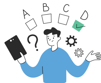
MIDORI QUIZ RALLY イメージ

日時 | 5月3日(土)~5日(月・祝) 10:30~19:00 ※4日(日)は20:00まで 場所 | ラリーポイント:グラングリーン大阪内各ブース ノバルティ引き換え所:サウスポーク水盤周辺