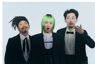
Awesome City Club