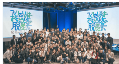
MIDORI CHALLENGE CONTEST イメージ