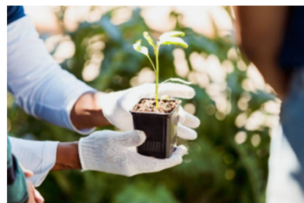
MIDORI SOUVENIR イメージ

日時 | 5月3日(土)~5日(月・祝) 10:30~19:00 ※4日(日)は20:00まで 場所 | 植物引き換え所:サウスポーク水盤周辺 ※詳細情報はHPまたは公式SNSにて追って公開予定