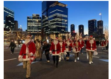
「Grand Santa Parade」