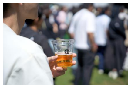
リサイクルカップ活用 イメージ

日時 | 5月2日(土)～4日(月・祝) 10:30～20:00 場所 | 各飲食ブース ※一部カップ利用対象外の店舗あり