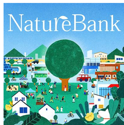
NatureBankクイズラリー イメージ

日時 | 5月2日(土)～4日(月・祝) 10:30～20:00 場所 | ラリーポイント: グラングリーン大阪内各ブース ノベルティ引き換え所: サウスポーク水盤周辺