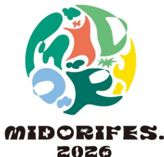
「MIDORI FES. 2026」ロゴ

【公式SNS】 Instagram: @grand.green.osaka X: @GGOsakaPR Facebook: @GGOsakaPR