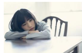
さちかぜあきの ※オープニングアクト

「夢を応援するまち」グランフロント大阪、グラングリーン大阪とFM802がうめきたのストリートから全国・世界へ羽ばたくミュージシャンを応援するドリームプロジェクト。