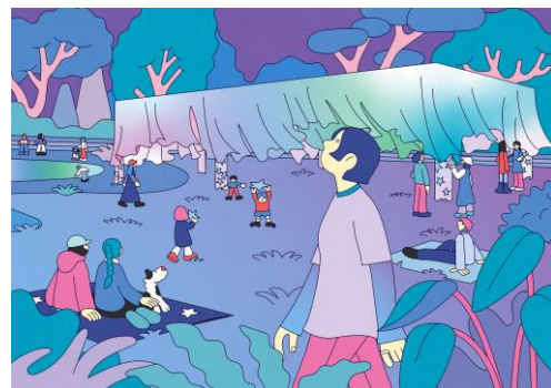
MIRAI MILKY WAY イメージ

アクションを体験した方全員には星をイメージしたこんぺいとうをプレゼントします。イベントに参加されるみなさまが「フェスの主役」です！是非トライしてみてください。