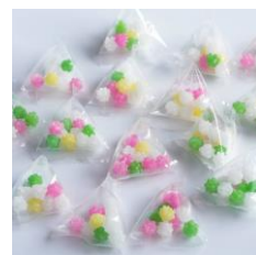
こんぺいとうイメージ

日時 | 5月2日(土)～4日(月・祝) 10:30～20:00 ※ライトアップは18:00～20:00 場所 | サウスポーク水盤周辺 ※雨天時、強風時はカードの取りつけは休止となります。 ※上記を除く場合でも、安全性確保のため予告なく休止する可能性があります。