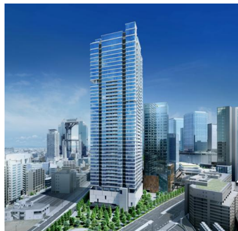
自然と都市機能が調和するグラングリーン大阪の「南街区」に立地 イメージ