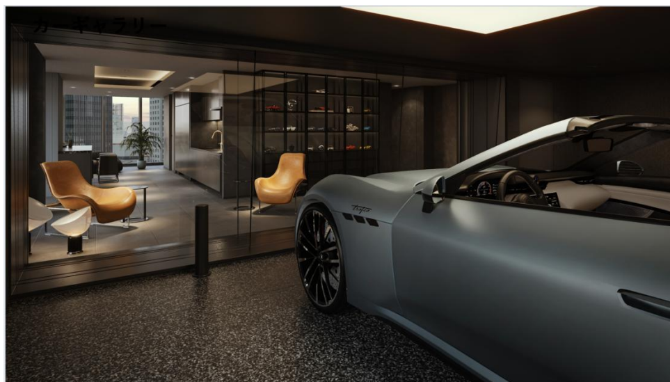
カーギャラリー付き住戸 イメージ