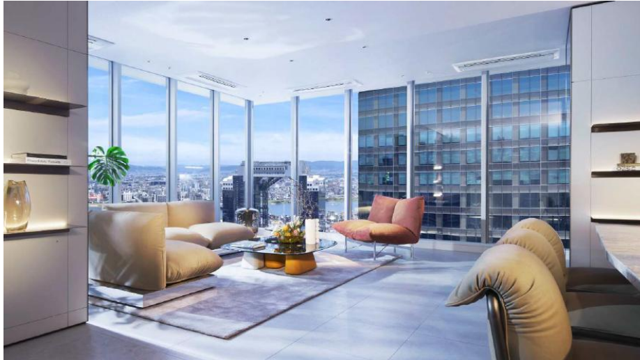
フルハイトサッシを全面窓に使用した高層階の居室 イメージ

当レジデンスの設計コンセプトは「THE SUITE 空と対話する」です。より軽やかに、より開放的に、空とのつながりを感じる住まいを目指しました。その象徴となるのが、新たに開発した床から天井まで届くフルハイトサッシです。当レジデンスでは、全面窓を多用したデザインに加え、このフルハイトサッシを採用することで、室内と外の境界をできる限り薄くし、視界の広がりを最大限に生かし、日々の暮らしを、どこかスイートルームのような特別な体験へと引き上げます。