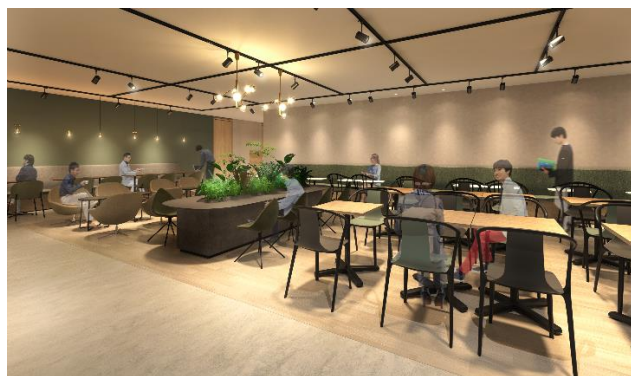
南館の休憩室 ※2025年春頃オープン予定