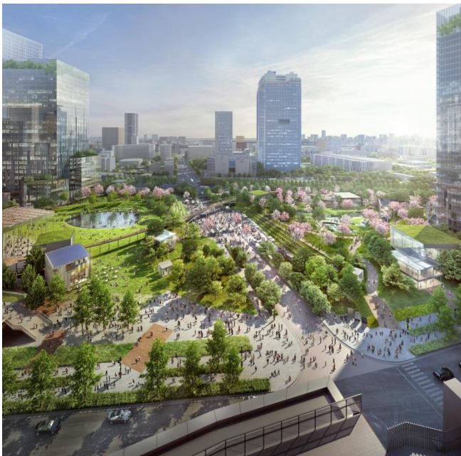
都市公園全景 (完成予想イメージ)