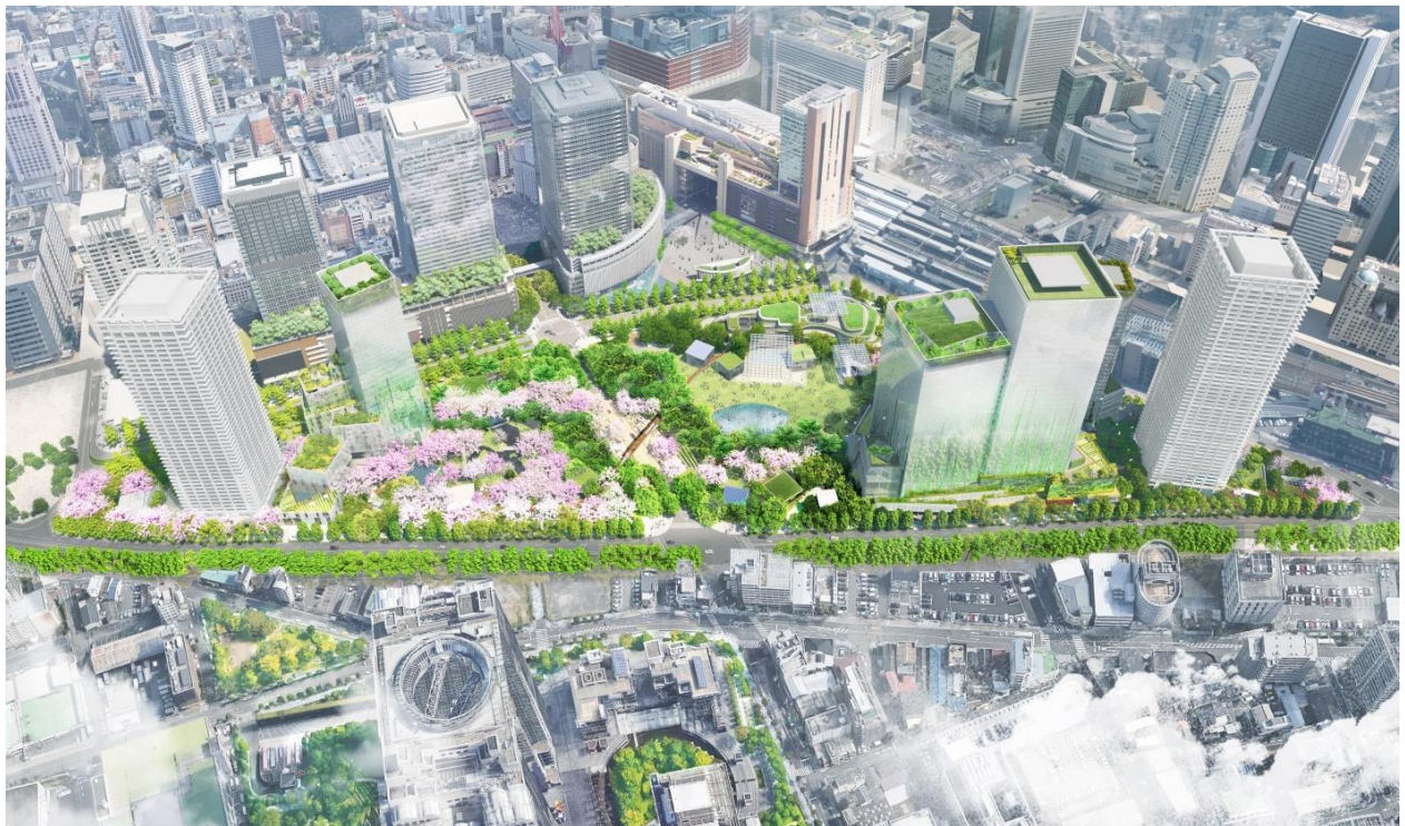
うめきた 2 期地区全景（完成予想イメージ）