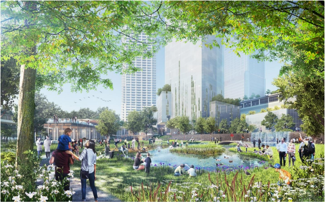
都市公園（北公園）の「うめきたの森」（完成予想イメージ）