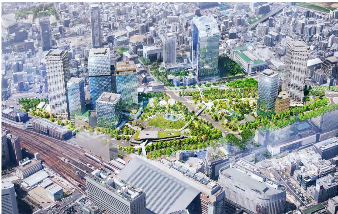
うめきた 2 期地区全景（完成予想イメージ）

事業者 JV は、大阪駅周辺・中之島・御堂筋周辺地域都市再生緊急整備協議会において策定された『「みどり ※2 」と「イノベーション」の融合拠点』というまちづくり方針の理念を踏まえつつ、「New normal/Next normal」「Society5.0」「SDGs」などに配慮した大阪の新しい都市モデルの実現を目指して、計画コンセプトのもと、引き続き公民連携の上、本プロジェクトを推進してまいります。