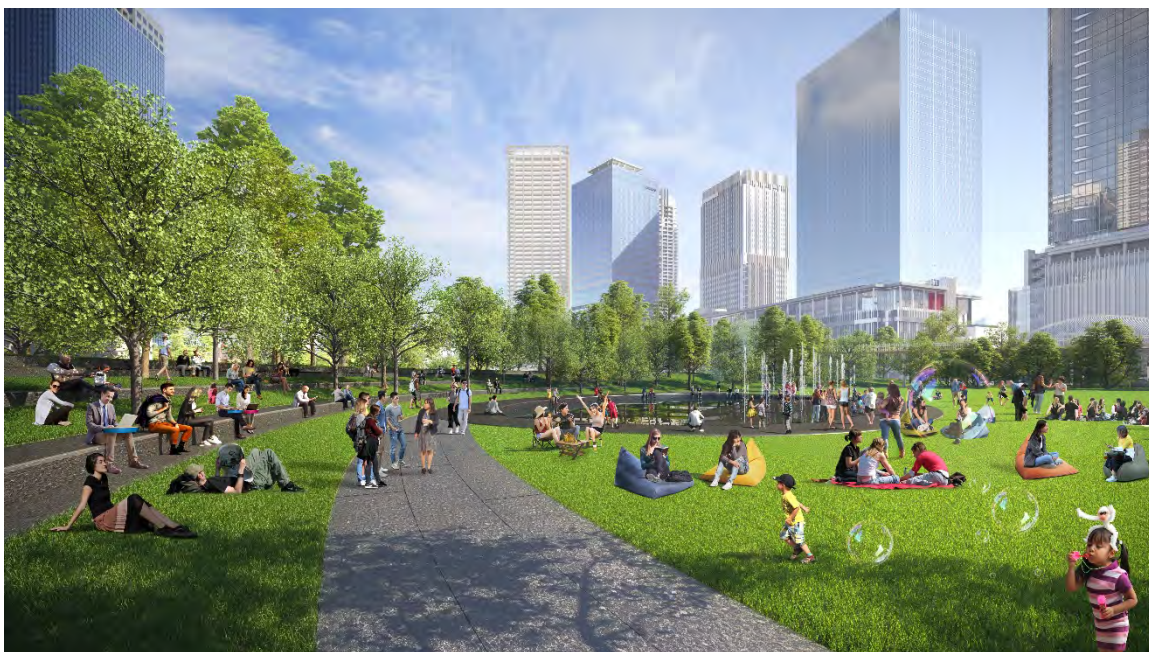
都市公園南エリア (完成予想イメージ)

https://www.mec.co.jp/j/news/archives/mec201117_umekitasquare.pdf