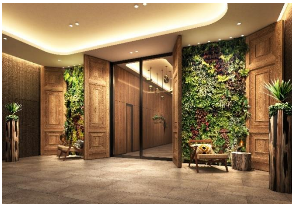
▲エントランス (完成予想イメージ)

大阪（梅田）を拠点にした、観光・レジャー目的の旅慣れた大人のインバウンドツーリストをメインターゲットにしており、ここにしかない新たな価値を創出することで、お客さまを、都会の喧騒を忘れることができる別世界へと誘います。