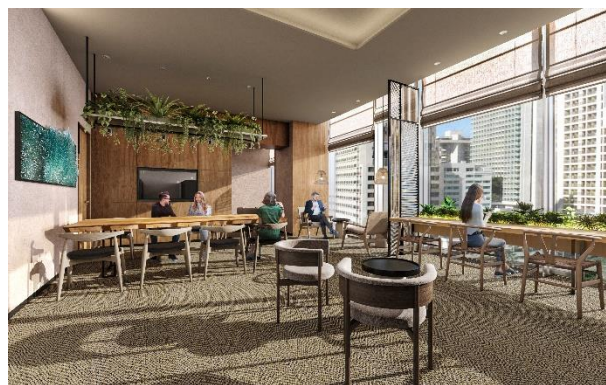
▲宿泊者専用ラウンジ (完成予想イメージ)