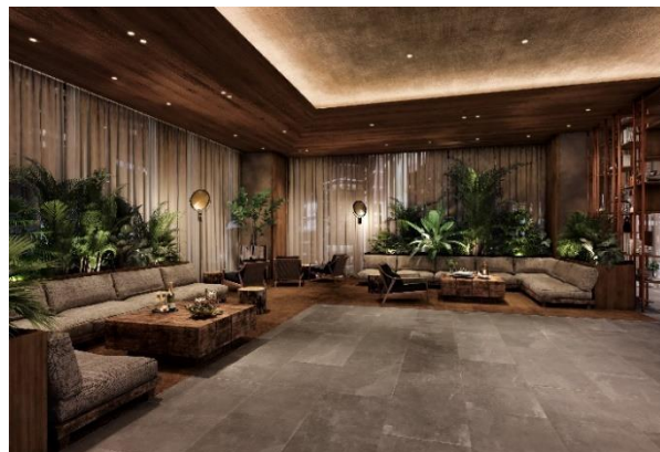
▲ホテルロビー (完成予想イメージ)